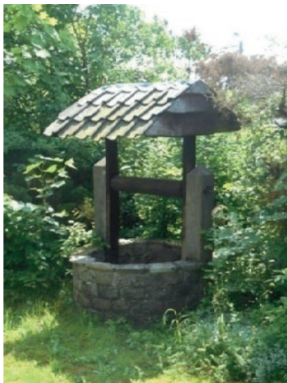
Le puits au jardin