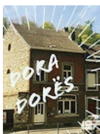
Dora dorës, « Main dans la main »