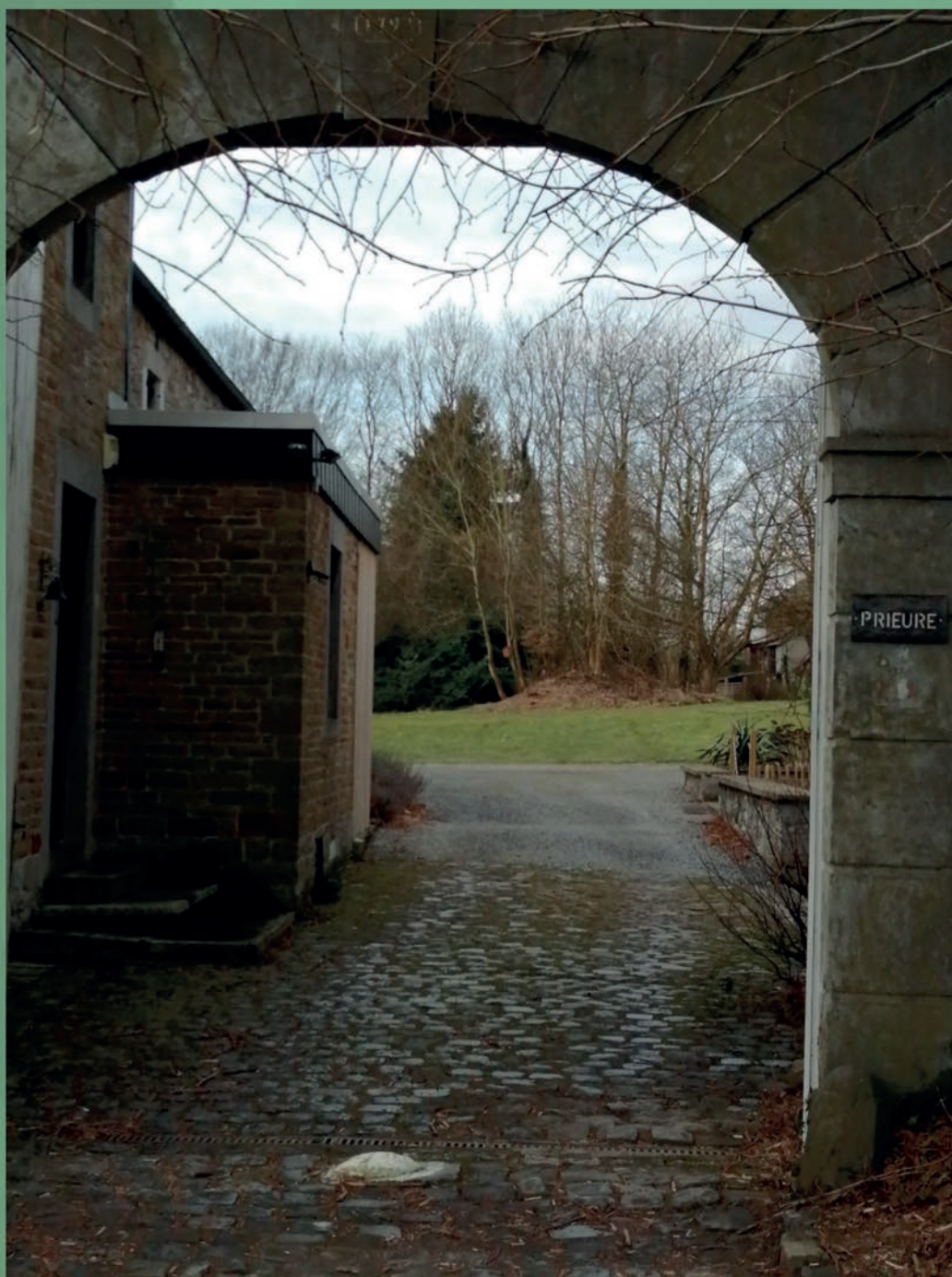
Le parc, le Prieuré, le presbytère et le secrétariat de l'UP.