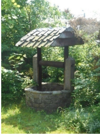
Le puits au jardin