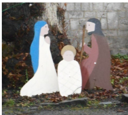
La crèche à l'entrée du Prieuré.

les dons des passants. Grand merci à celles et ceux qui l'ont garnie.