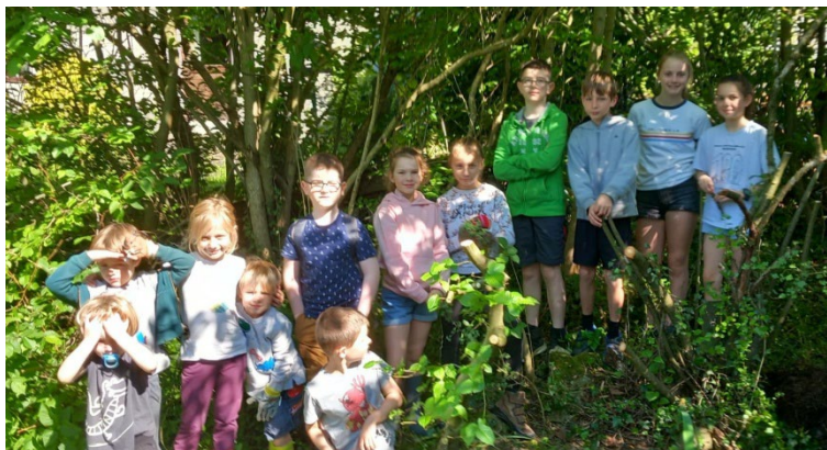
Le groupe des enfants du club Nature