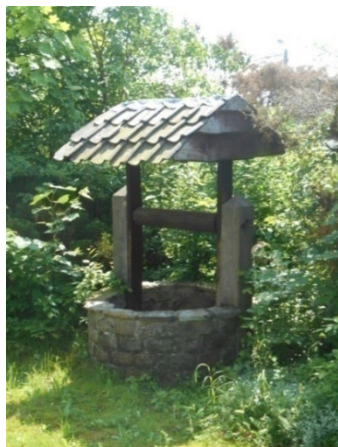
Le puits au jardin