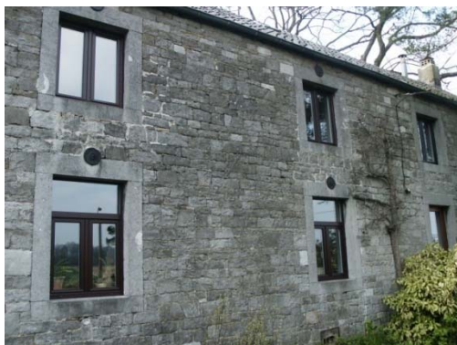
Le presbytère, côté jardin où se trouve le puits !