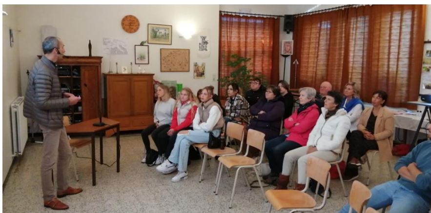
En matinée, avec les jeunes du CEFA Huy.