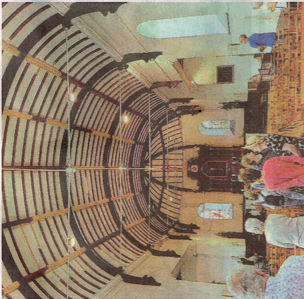
Les visiteurs ont admiré le plafond en coque de bateau renversé de l'église St-Martin à Les Avins