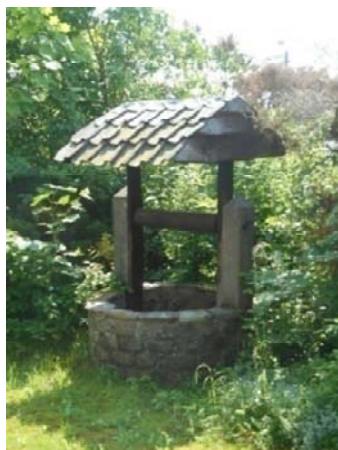
Le puits au jardin