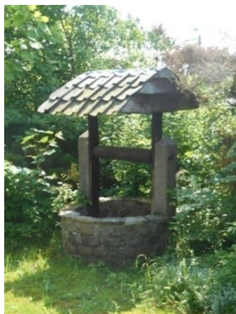
Le puits au jardin