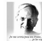
Je ne crois pas en Dieu... ... je le vis!