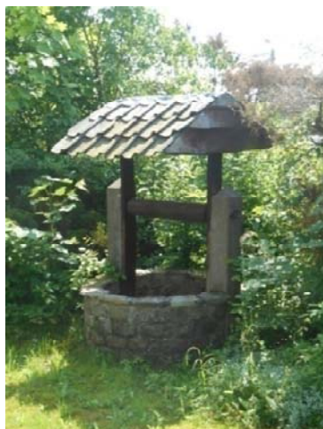
Le puits au jardin