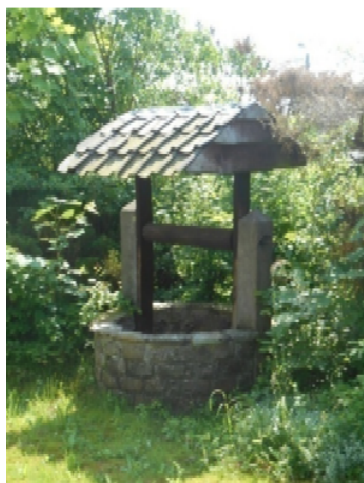
Le puits au jardin