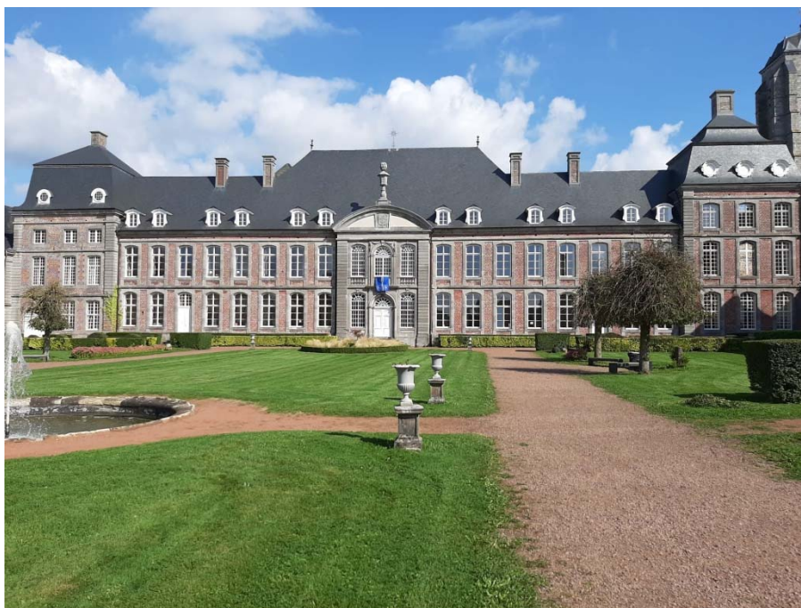
Abbaye N-D de Bonne-Espérance (corps principal)