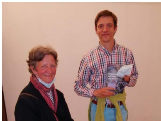
En compagnie de sa maman, amie fidèle du Prieuré

Fondée par les Jésuites, l'association est subsidiée par le Ministère de la Culture. Elle fonctionne avec six collaborateurs.