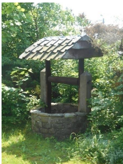
Le puits au jardin .