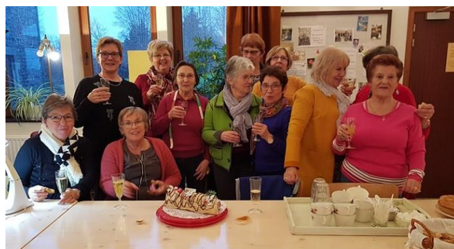
Goûter de Noël 2019.