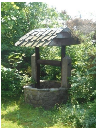
Le puits au jardin .