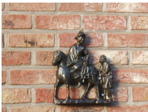
Le nouveau St-Martin en fonte accroché au-dessus de la salle d'accueil sur la façade du bâtiment! MERCI Jean-Luc!!!

4 jours de recollection pour l'Ecole Saint Louis de Liège en octobre.