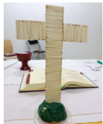
Photo: Le Christ de la célébration de la confirmation a été réalisé par le détenu sacristain à l'aide de boîtes et de bois d'allumettes mais aussi avec des morceaux d'éponges à récurer.