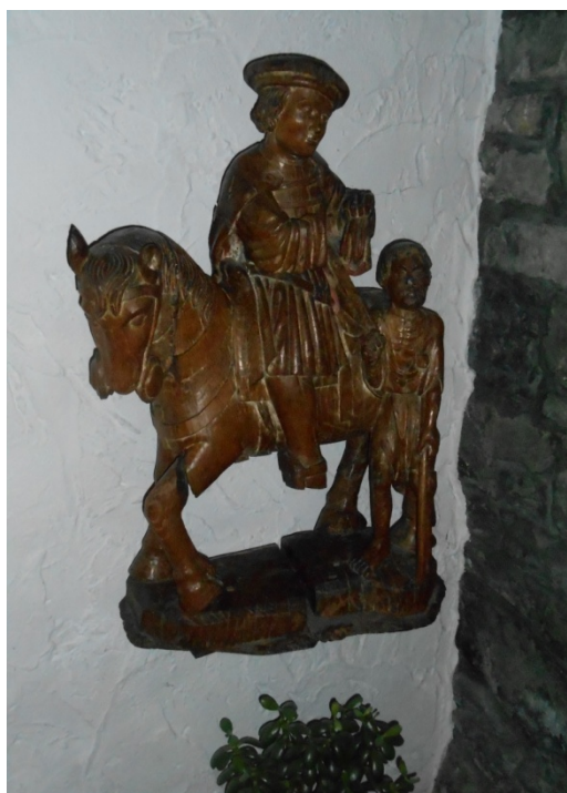
St-Martin à l'oratoire.