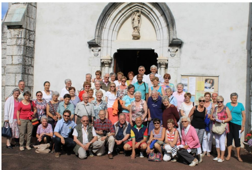
Devant l'église du "Viviers du Lac"